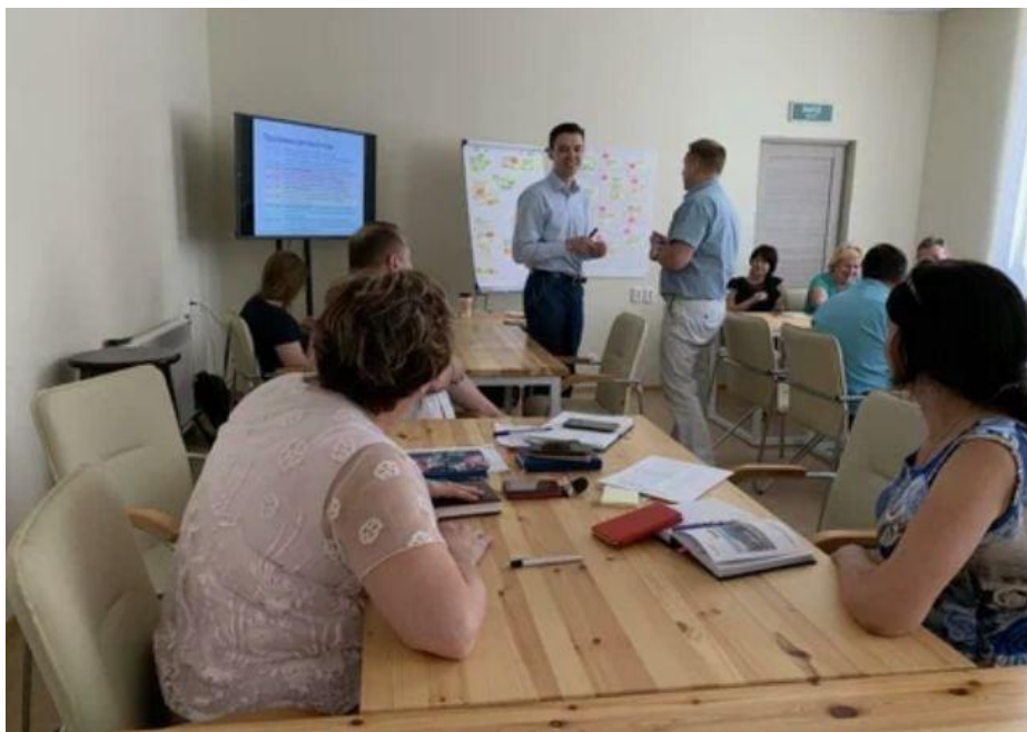
Пример хода деловой игры